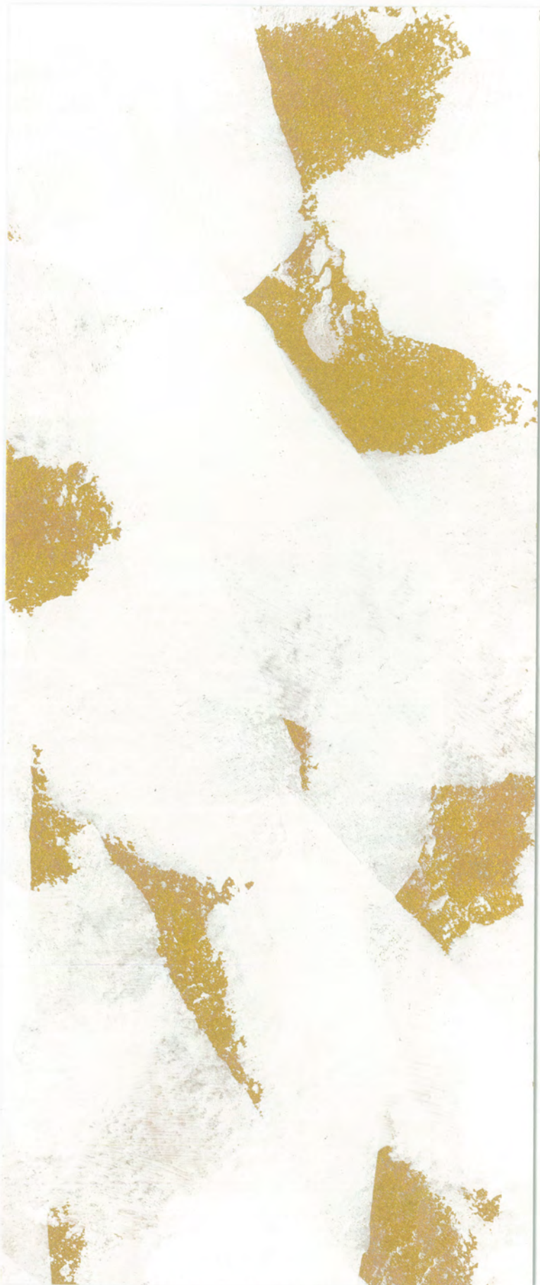
Marcopolo Luxury 0195 e Fenice 0019 - Effetto Roccia