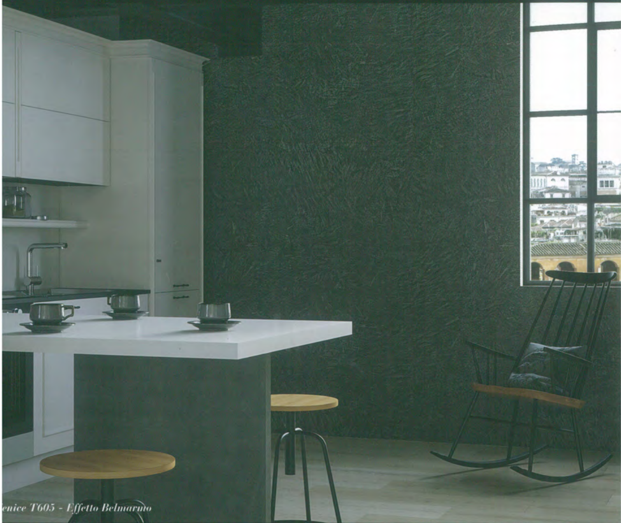
Fenice T605 - Effetto Belmarmo

RIVESTIMENTO DECORATIVO MINERALE PER INTERNI