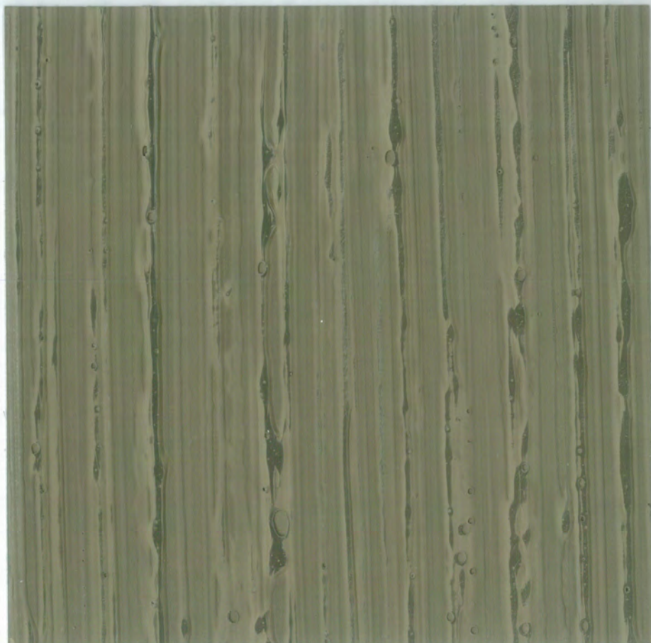
T611 - Effetto Storia